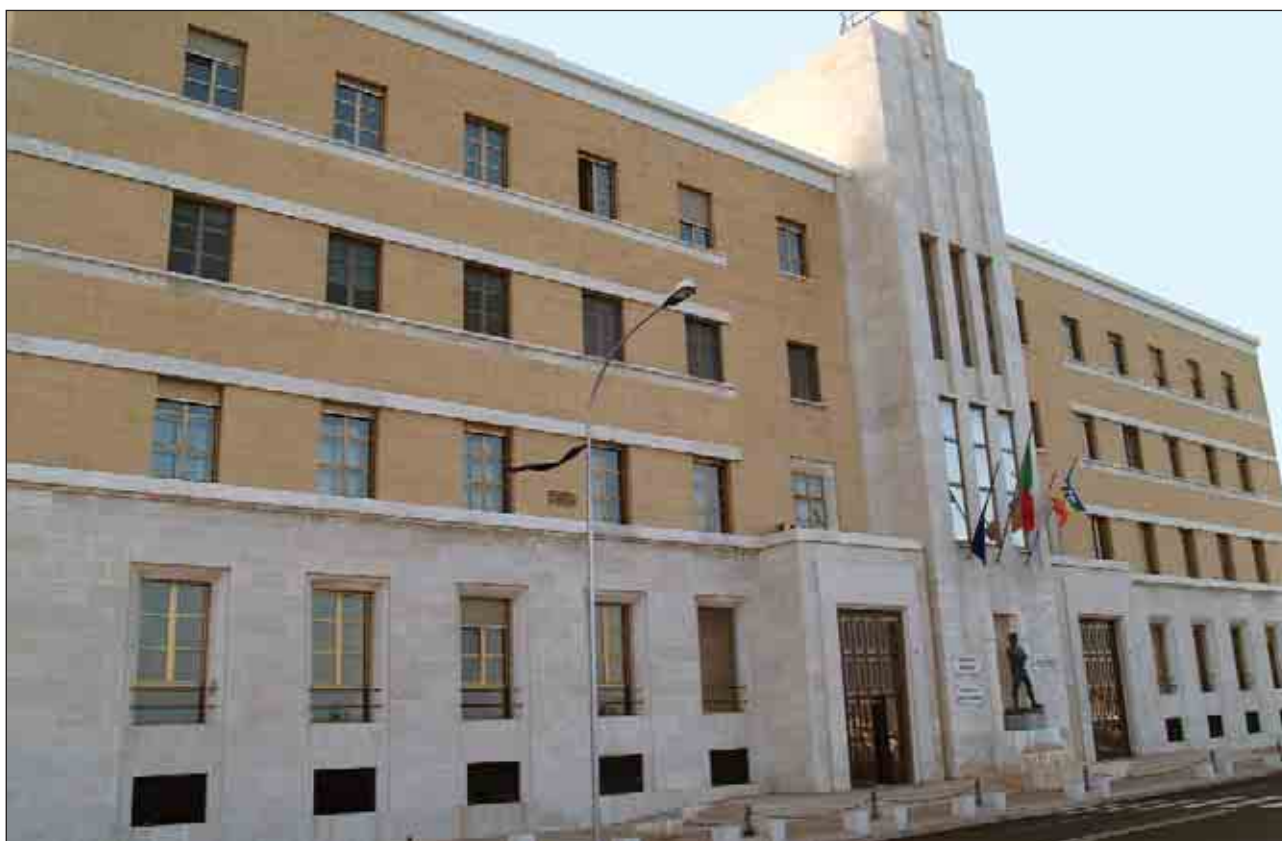
Sede Presidenza Giunta Regionale